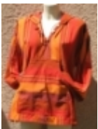
Coat À capuche orange €39.00

Coat H/F de couleur bleu À capuche, 100 % drap de coton tissé main. [Détails du produit...]