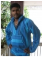
Coat À capuche bleu €39.00

Cette magnifique petite blouse rouge aux manches 3/4 ballon est faite en 100% coton soyeux. Elle s'accorde parfaitement sur un pantalon comme une jupe pour un style d'contract et glamour. [Détails du produit...]