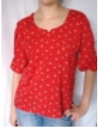
Blouse rouge €22.00

Cette magnifique petite blouse rouge aux manches 3/4 ballon est faite en 100% coton soyeux. Elle s'accorde parfaitement sur un pantalon comme une jupe pour un style d'contract et glamour. [Détails du produit...]