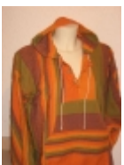
Coat À capuche orange-mauve €39.00

Coat H/F de couleur orange À capuche, 100 % drap de coton tissé main. [Détails du produit...]